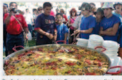
Paellada popular en Nueva Segovia en unas fiestas anteriores.

El esfuerzo de las peñas (en el que ha sido clave el trabajo de Carritos, Iván, Nacho, Ruso y Rodrigo) se verá reflejado en los festejos taurinos, como el recurso nacional de recortes del día 4, con la presencia del campeón de España, Rubén Monzón, la becerrada, las verbenas y las comidas populares.